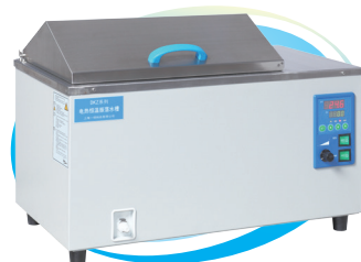
振荡水槽 DKZ-1/DKZ-2 DKZ-3/DKZ-2B